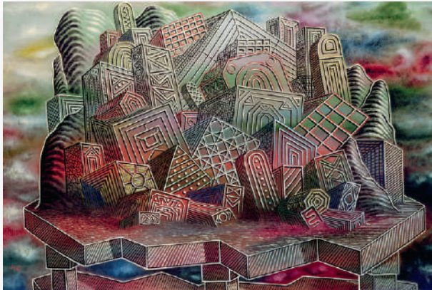
The Project of History- Histories of Projects , visuel du colloque international à l'Université de Florence, 16 et 17 novembre 2023