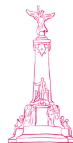
SIR GEORGE-ÉTIENNE CARTIER